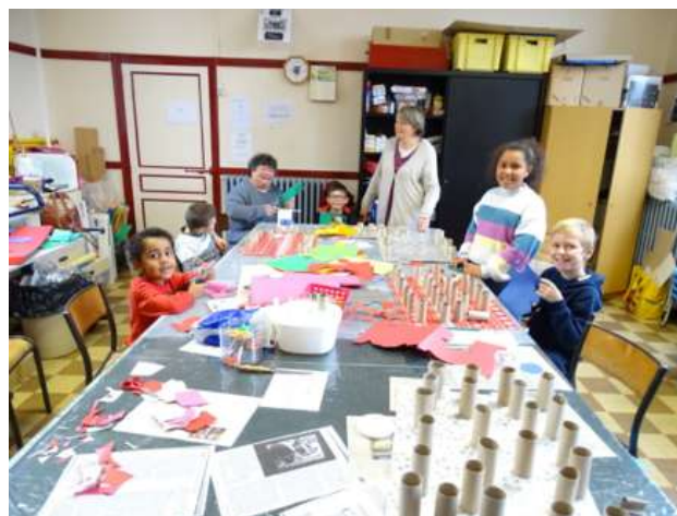
Les enfants fabriquent des calendriers d'Avent

08 janvier 08 avril 15 janvier 29 avril 22 janvier 06 mai 05 février 13 mai 12 février 27 mai 19 février 03 juin 26 février 17 juin 04 mars 24 juin 11 mars 01 juillet 18 mars